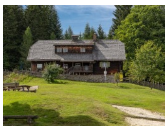
Standort Rosegger-Geburtshaus Alpi